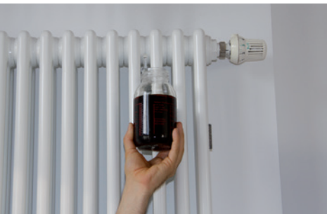
HEIZUNGSWASSER OHNE UMH

Gerne möchten wir über die Erfahrung mit den UMH-Heat-Geräten, welche wir in unsere zwei großen Häuser im Frühjahr 2011 eingebaut haben, berichten. Kürzlich wurden wiederum Wasserproben aus dem Heizungssystem entnommen. Wie schon bei früheren Inspektionen zeigte sich, dass das Heizungswasser völlig klar und schmutzfrei ist.